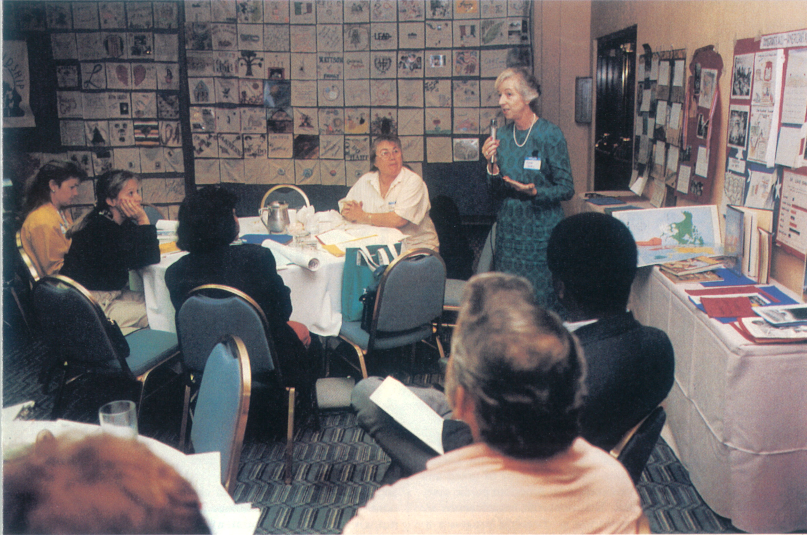
'90年11月にサンディエゴ市内のホテルで行われた、「アメリカンズ・オール」プログラムの成果発表会。先生や、家族、コミュニティーの人たちも集まり、正面の壁には数百枚のキルト作品も展示された。子供たちがお国柄を表した作品を一枚ずつ見ているといつまでもあきない。