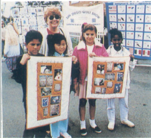
Above: Community, the school and parents get together to exhibit these beautiful quilts that illustrate each child's family and cultural heritage in San Diego. This program was part of the Americans All project, a multi-cultural education program.

The Hitachi Foundation was founded in 1985 in celebration of the 75th anniversary of Hitachi, Ltd. Today, it is one of the best known of the approximately 20 foundations that have been established in the United States by Japanese companies.